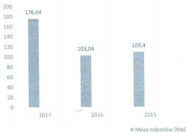
Zmieszane odpady komunalne o kodzie 20 03 01 w latach 2015-2017