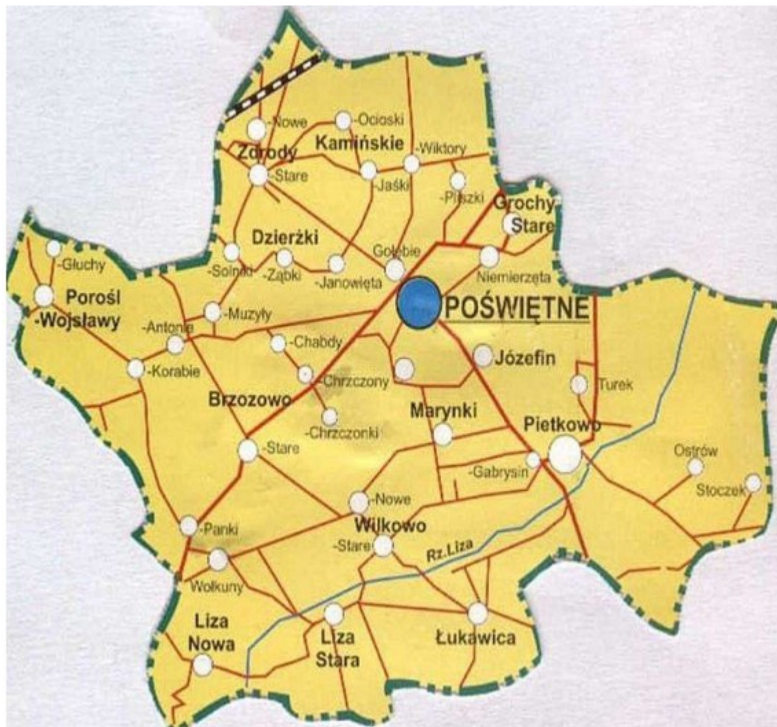
Rysunek 3 Miejscowość Poświętne na tle Gminy Poświętne

Gmina Poświętne jest gminą wiejską i swoim zasięgiem obejmuje obszar o powierzchni 114km 2 , na którym zamieszkuje 3604 mieszkańców. Gmina obejmuje 34 sołectwa i 35 miejscowości.