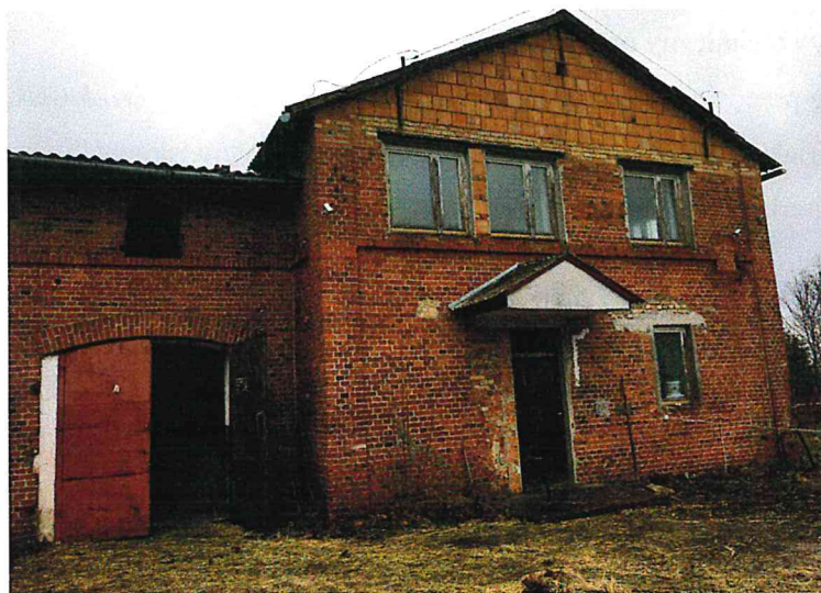
zdj. nr 1 - widok na wejście główne do części socjalno - biurowej