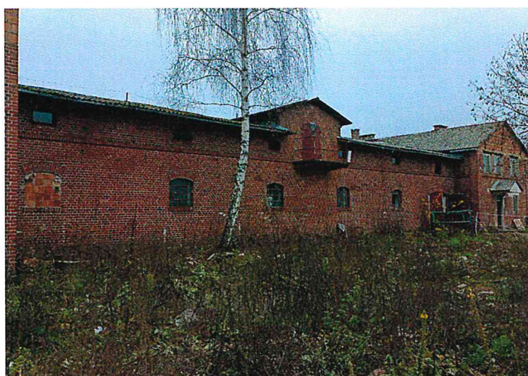
zdi. nr 3 - część stajenna - widok od strony południowo-wschodniej