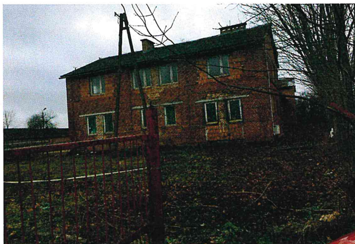
zdi. nr 2 - elewacja boczna części socjalno - biurowej