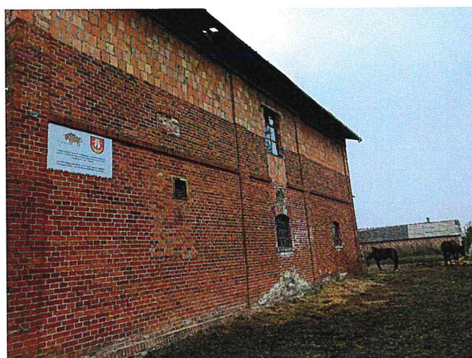
zdi. nr 5 i 6 - skrzydło od strony południowo-zachodniej